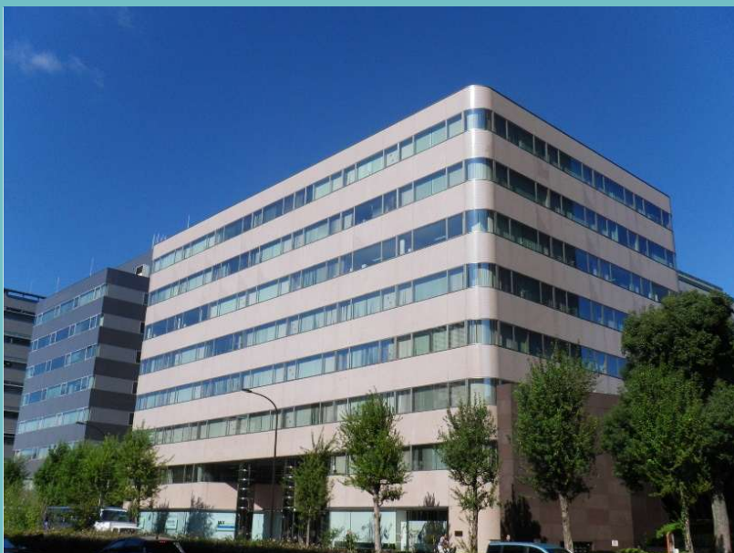
◆ 建物外観 ◆